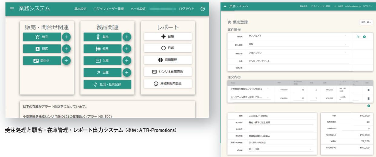
受注処理と顧客・在庫管理・レポート出力システム