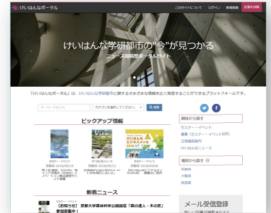
けいはんなポータル https://keihanna-portal.jp/ (運営: 関西文化学術研究都市推進機構)